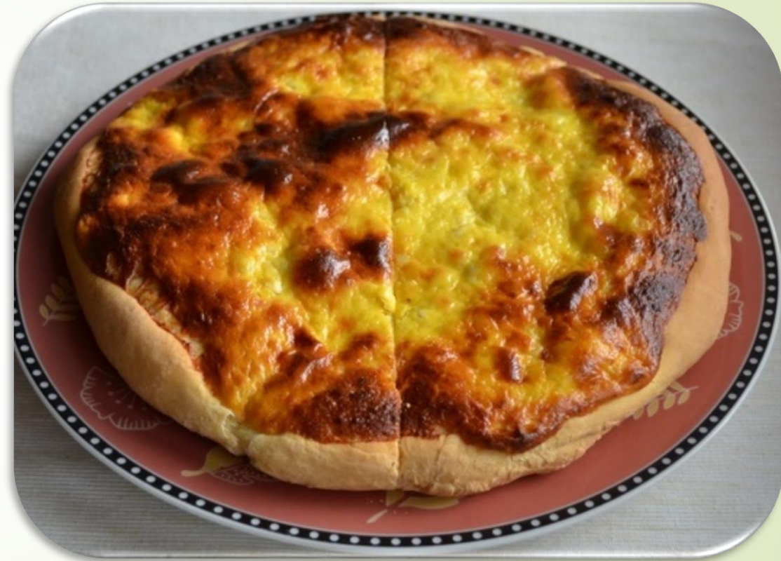
Máréfalvi tejfölös lepény